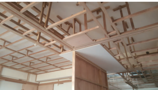
3IN綠能角材現場施工照